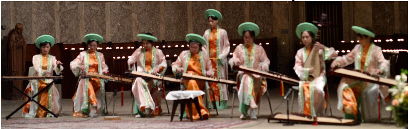
Les groupes Phương Ca, Montréal et Tre Việt, Toronto

Le programme peut être sujet à changement. Vérifiez les dates, heures et lieux sur https://centreculturelvietnamien.ca/evenements/centre-culturel-vietnamien/