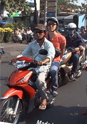
Made in Vietnam