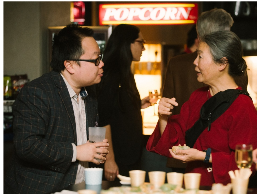
Soirée de lancement du documentaire Du lotus à l'érable