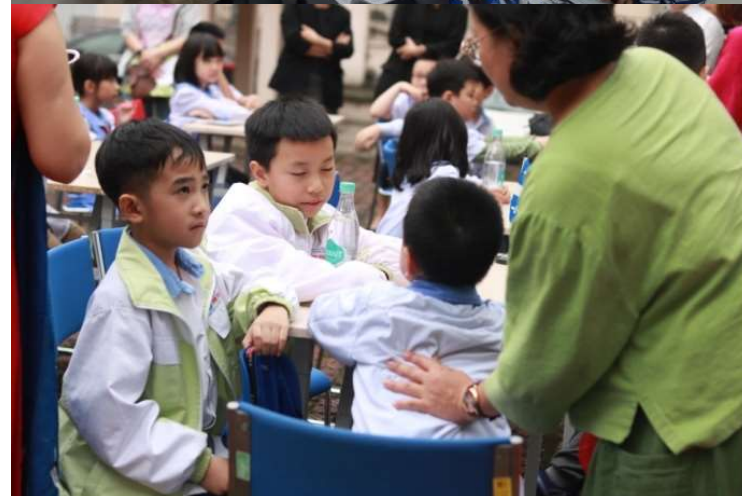
Atelier de dessins avec de jeunes hanoïens, mars 2023