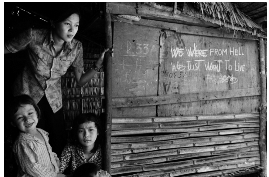
We were from Hell , photographie de Claire Beaugrand-Champagne ( Du lotus à l'érable )