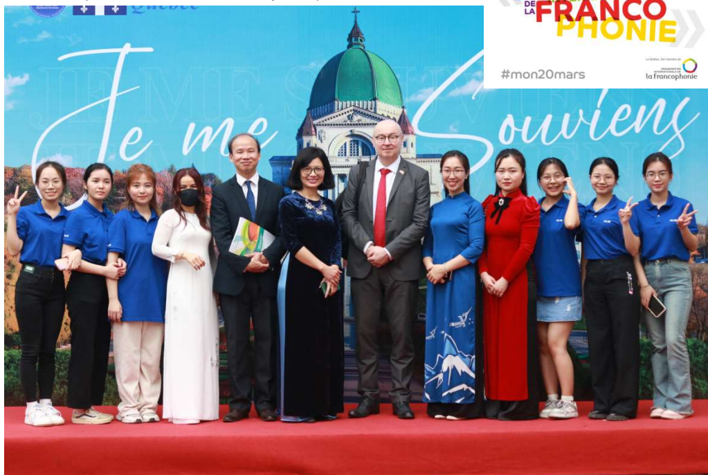
Plateau d'Espace Québec, Journée de la francophonie, mars 2024

Chaque printemps, Espace Québec participe à la Journée internationale de la Francophonie. Y participent également un.e représentant.e de l'OIF (Organisation internationale de la francophonie), de la France et de la Wallonie-Bruxelles