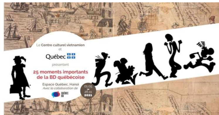
Exposition sur la BD québécoise, 2021 ci-dessus. / Exposition de photos de Claire Beaugrand-Champagne, 2022 ci-dessous