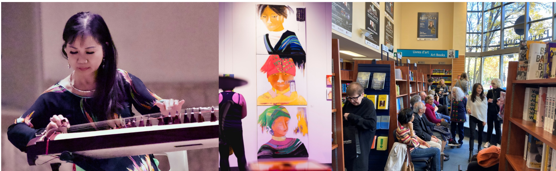
Images de la 5 e édition des Semaines culturelles vietnamiennes, 2023